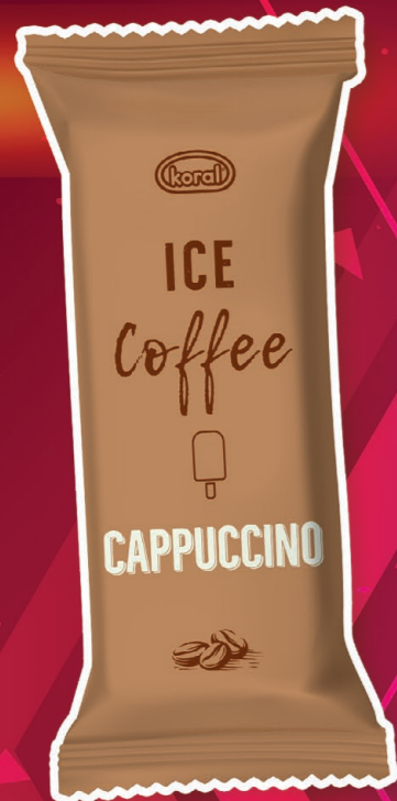
ICE COFFEE CAPPUCCINO 90 ml o smaku śmietankowo-kawowym sztuk w kartonie 34 kartonów na palecie 160